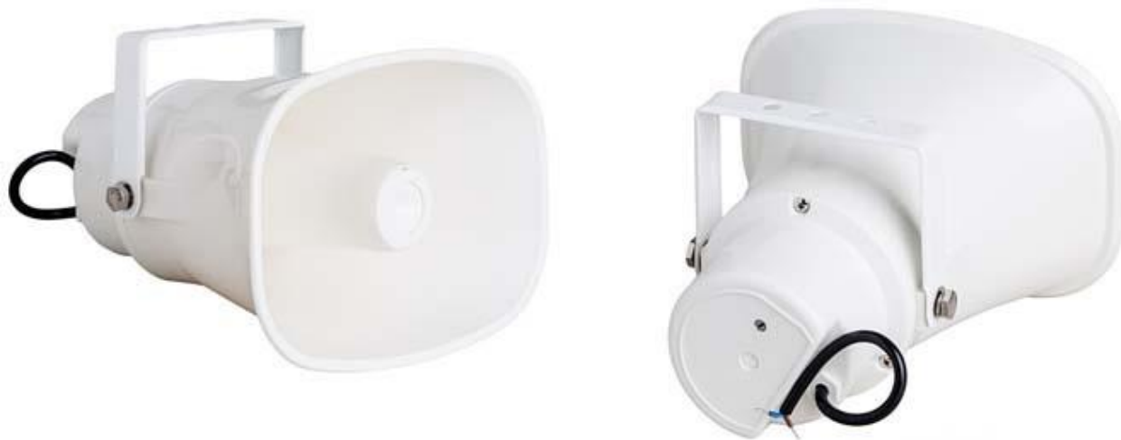
Рис. 1. Внешний вид громкоговорителя.

Внешний вид громкоговорителя показан на рис. 1.